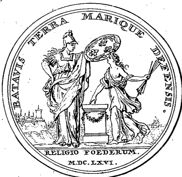
C'est par la protection que la France a donnée a la Hollande, que la Puissance des Etats s'est établie, et qu'elle a Subsisté plus d'un Siecle.