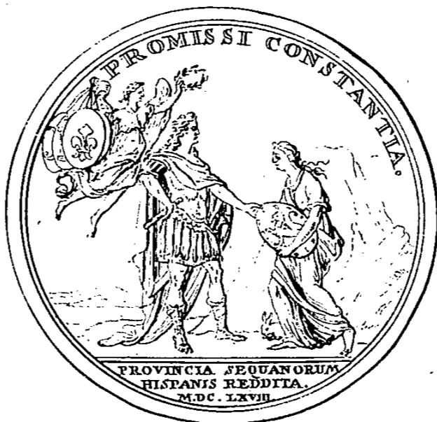
le Roy après ses conquêtes, seulement POUR GARDER SA PAROLE, rend aux Espagnols la Franche Comté 1668.