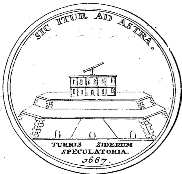
le Roy après avoir établi une Académie des Sciences, fait bastir un Palais magnifique POUR OBSERVER LES ASTRES. 1667. on le nomme communement L'OBSERVATOIRE.