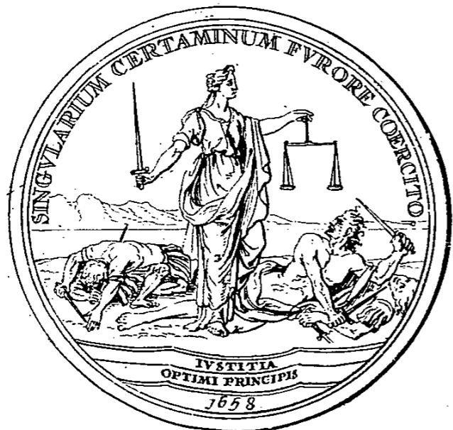
le Roy par la vigueur de ses Edits, et par sa fermeté a les faire observer, a enfin aboli les duels. et sa Justice tient également la Noblesse, et le Peuple dans le devoir.