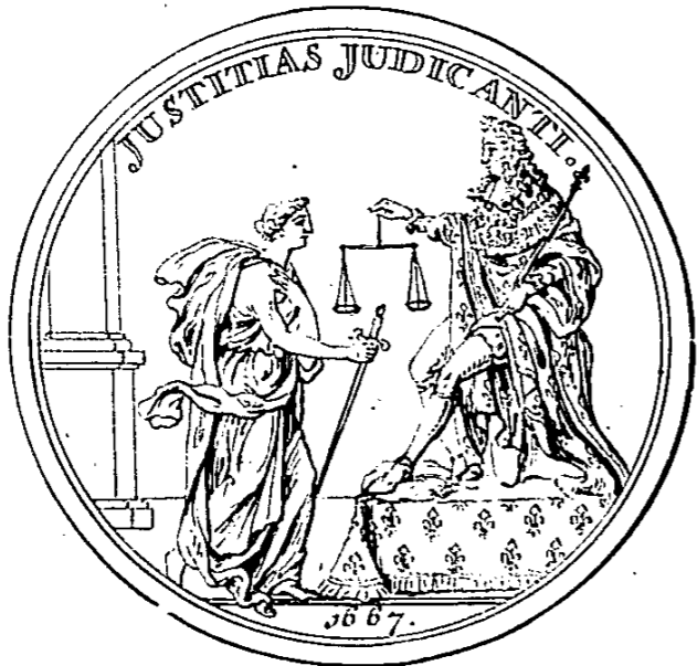
la Justice, remet ses balances, et son Espée entre les mains du Roy, qui est dans son trone comme LE IVGE DES IVGES.